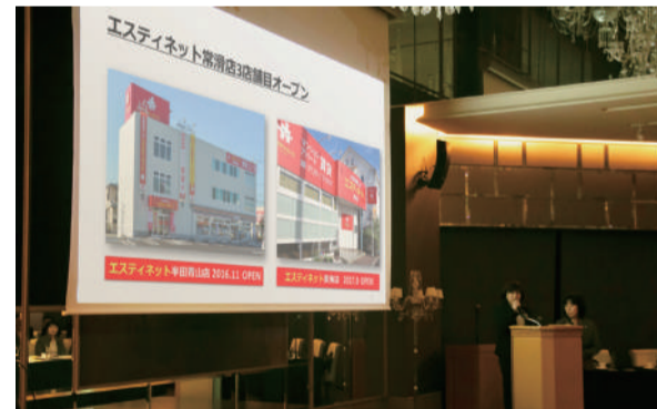
第6回 全国レディ体験発表会 in 名古屋での発表

いつも皆様にNEWS等をお届けしている、「エステイらいふレディ」のみなさんです。 今回は、様々な地域のレディさんが名古屋に集結。発表会・勉強会が開催されました。 ご訪問の際に、より良いご対応ができるよう、日々勉強しています。 今後とも、エステイらいふレディをよろしくお願いいたします。