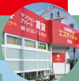
エスティネット 東海店