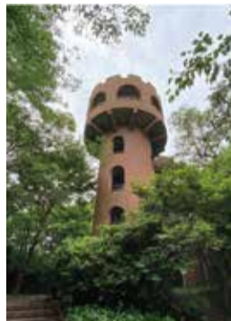
松原公園 愛知県常滑市松原 字神水地内

お散歩で体を動かしませんか？スタッフおすすめのお散歩エリアを紹介します。お出かけの際は感染症および熱中症予防対策をしっかりとしましょう！涼しい早朝や夕方のお散歩がおすすめです。