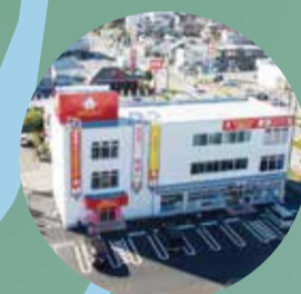
エスティネット 半田青山店