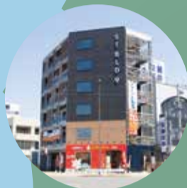
エスティネット 常滑店