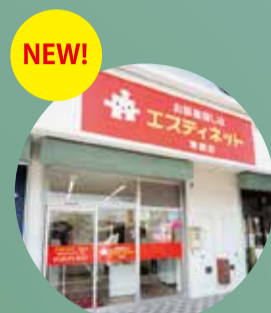
エスティネット 東浦店