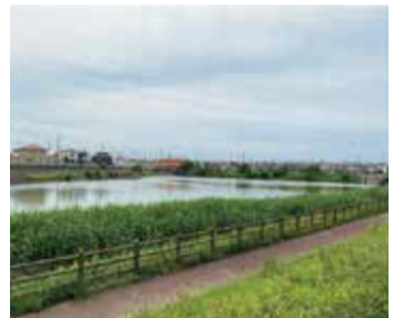
鹿狩池公園 愛知県知多郡武豊町字平井 1丁目59-2

半田市と武豊町の間にある鹿狩池公園にはグラウンドや大きな池、水上デッキなどが整備されています。公園をぐるっと回ることが出来る765mのウォーキングコースがあり、駐車場も完備されていますので、ちょっとした運動やお散歩にオススメです！また、小さなお子さんが遊べる遊具や虫取りのできるエリアなど、大きな道路の側にありながらも自然を感じることが出来ます。すぐそばには喫茶店もあるので運動やお散歩の帰りに寄ってみてはいかがでしょうか？ ひらけていて気持ちの良い公園ですが、陽を遮るものが少ないため、帽子などをかぶることをオススメします。