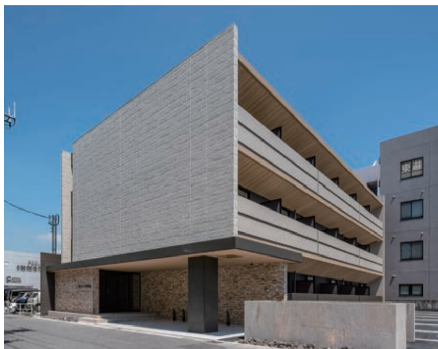
タイル仕上げで省メンテナンスを実現した外観

次世代へ残す末永い事業として将来の負担を抑えられるように耐久性を考慮し、外観は汚れ