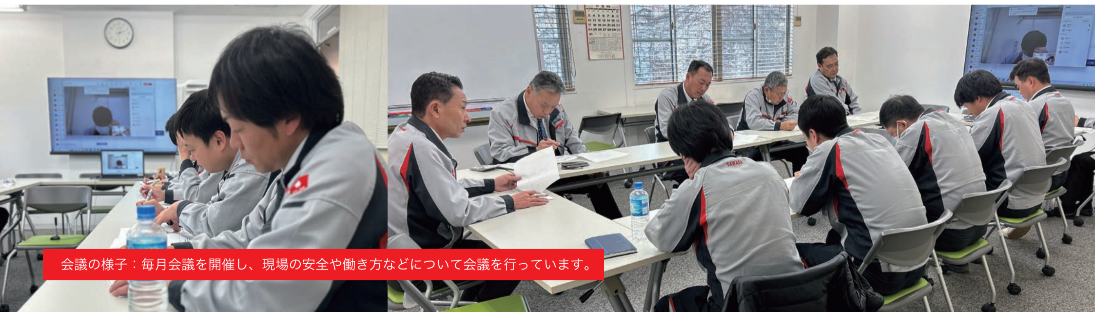
会議の様子：毎月会議を開催し、現場の安全や働き方などについて会議を行っています。

安全衛生委員会は社内に設置された組織です。現場の安全を最優先に、事故防止だけでなく、従業員と協力会社の健康維持、作業環境の改善、そして品質の継続的な向上に取り組んでいます。