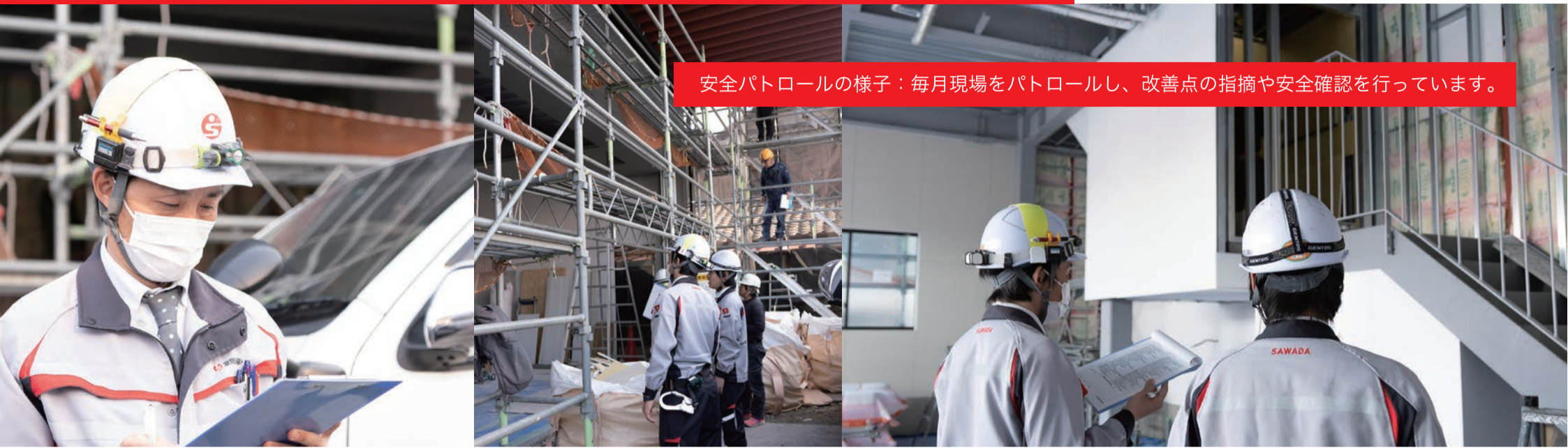
安全パトロールの様子：毎月現場をパトロールし、改善点の指摘や安全確認を行っています。