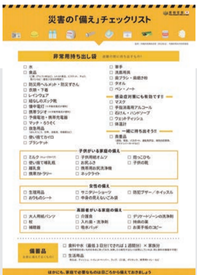
首相官邸公式サイト 防災ページより引用 https://www.kantei.go.jp/jp/headline/bousai/index.html